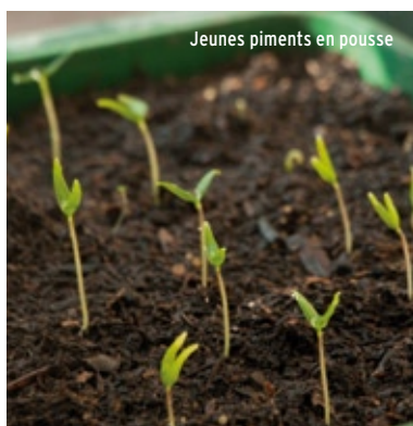
Jeunes piments en pousse

La quarantaine d'habitants et les associations du collectif Jardin Saint-Esprit ont mis leur enthousiasme en commun pour donner une autre couleur à la rue . Ainsi, plus de cinquante bacs seront bientôt installés et gérés par les habitants et les associations. Le collectif a tenu à féderer le plus grand nombre autour de ce projet d'embellissement de la rue: habitants, commerçants, enfants des écoles, personnes âgées... Une énergie considérable a été déployée pour permettre à tout un chacun de participer.