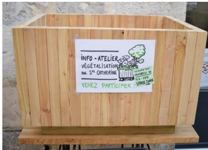
↑ Un modèle type des bacs qui seront installés rue Sainte-Catherine!

Président de la Communauté d'agglomération Pays Basque