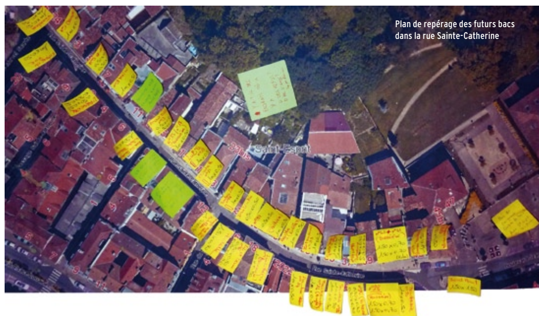
Plan de repérage des futurs bacs dans la rue Sainte-Catherine